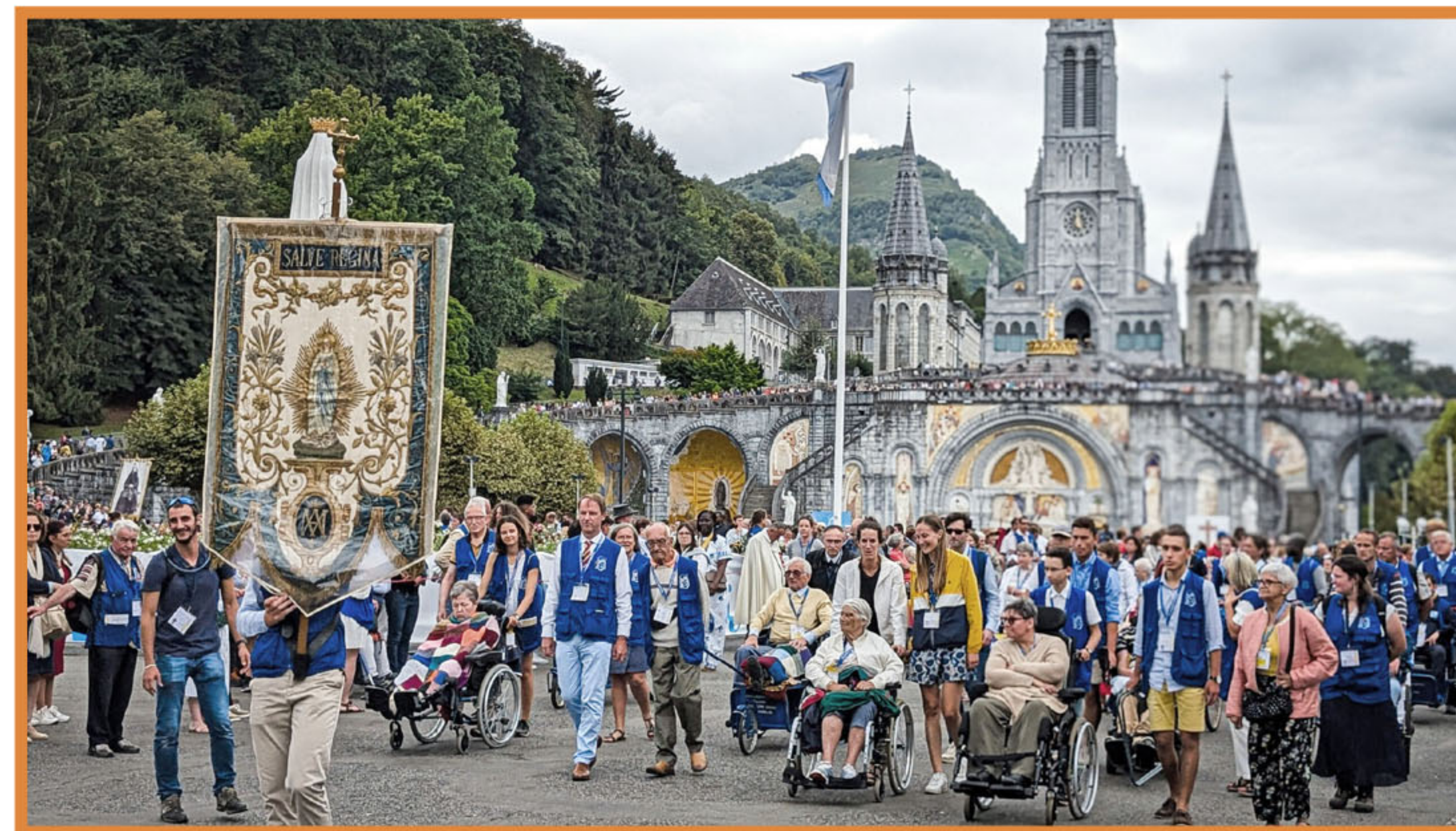
Pèlerinage national à Lourdes

chrétienne en dehors des lieux de culte : processions, pèlerinages, neuvaines, vénération des reliques et des saints, bénédictions diverses.