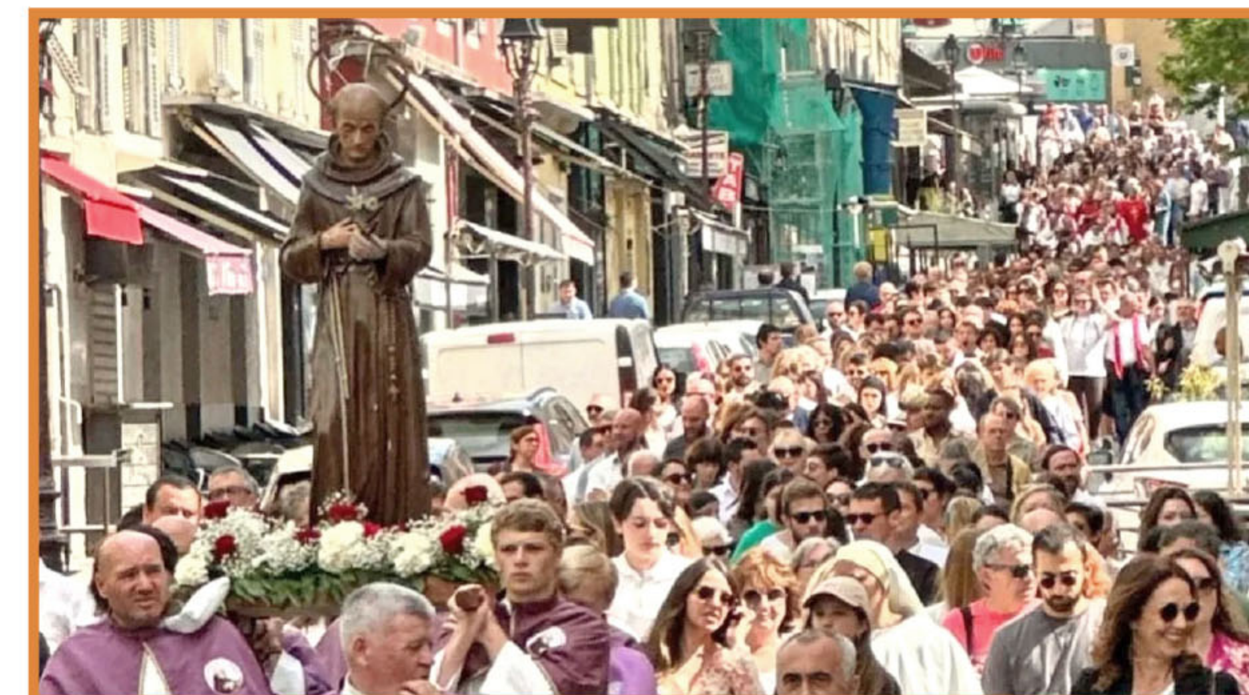
Procession dans le diocèse d'Ajaccio

Mais le pape François met en garde contre les dérives folkloriques et superstitieuses de la piété populaire. Il invite les pasteurs au discernement : elle peut être utilisée, instrumentalisée « par des groupes pour renforcer leur identité de manière polémique, en alimentant des particularismes, des attitudes d'exclusion, ... tandis que l'authentique piété populaire harmonise les valeurs culturelles d'un peuple et la foi chrétienne, unissant les cœurs et fusionnant une communauté » (Colloque du 15/12/24). Le défi pour l'Eglise catholique est de guider les personnes vers un approfondissement spirituel. Le pape Léon XIV, lors de l'audience des responsables liturgiques, a appelé « à diffuser les connaissances de manière accessible, afin que chaque fidèle grandisse dans la connaissance du sens théologique de la liturgie, ne vous lassez pas de former le Peuple de Dieu ».